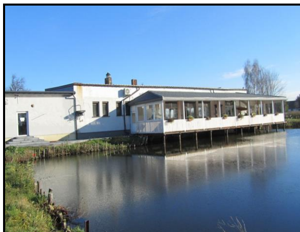
Restauracja „Złoty Karaś”