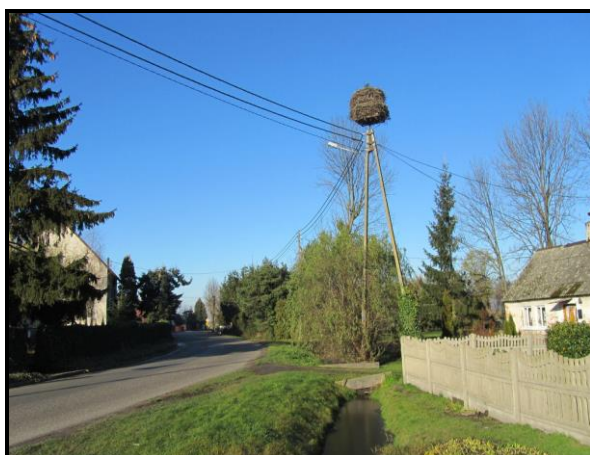
Wieloletnie gniazdo bociana białego