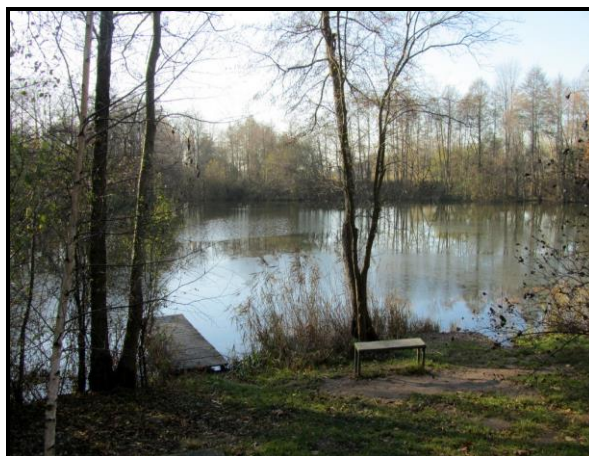
Prywatne łowisko w Lipce