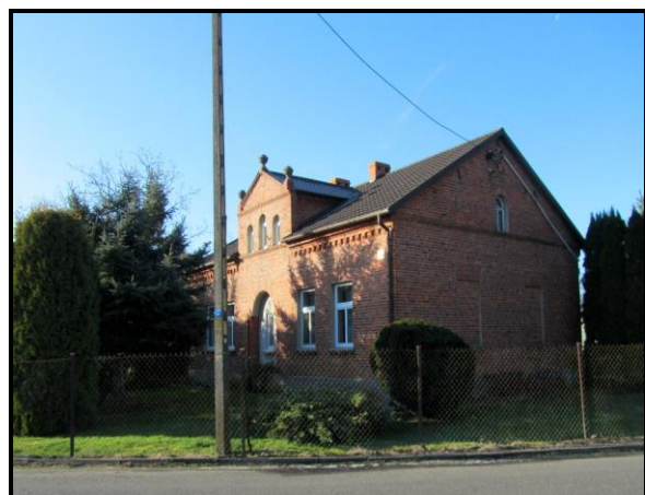
Zabudowa w sołectwie