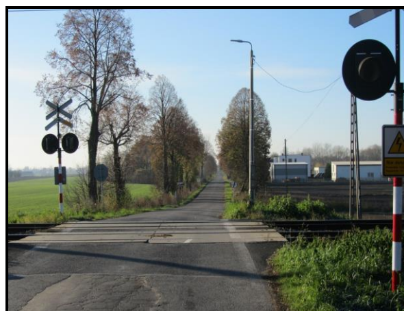
Przejazd kolejowy łączący Kościany z Lipką