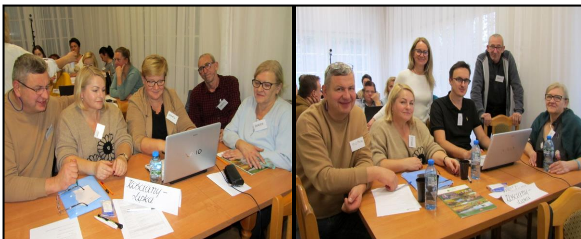
Grupa Odnowy Wsi w czasie warsztatów opracowania Sołeckiej Strategii Rozwoju Urząd Gminy w Szczytnikach w dniach 22-23.XI.2024 r.

SOLECKA STRATEGIA ROZWOJU – KOŚCIANY-LIPKA wypracowana przez GOW na warsztatach w ramach programu UMWW - „Wielkopolska Odnowa Wsi 2020+”