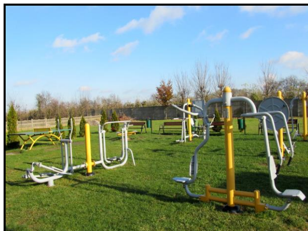
Miejsce sportu i rekreacji