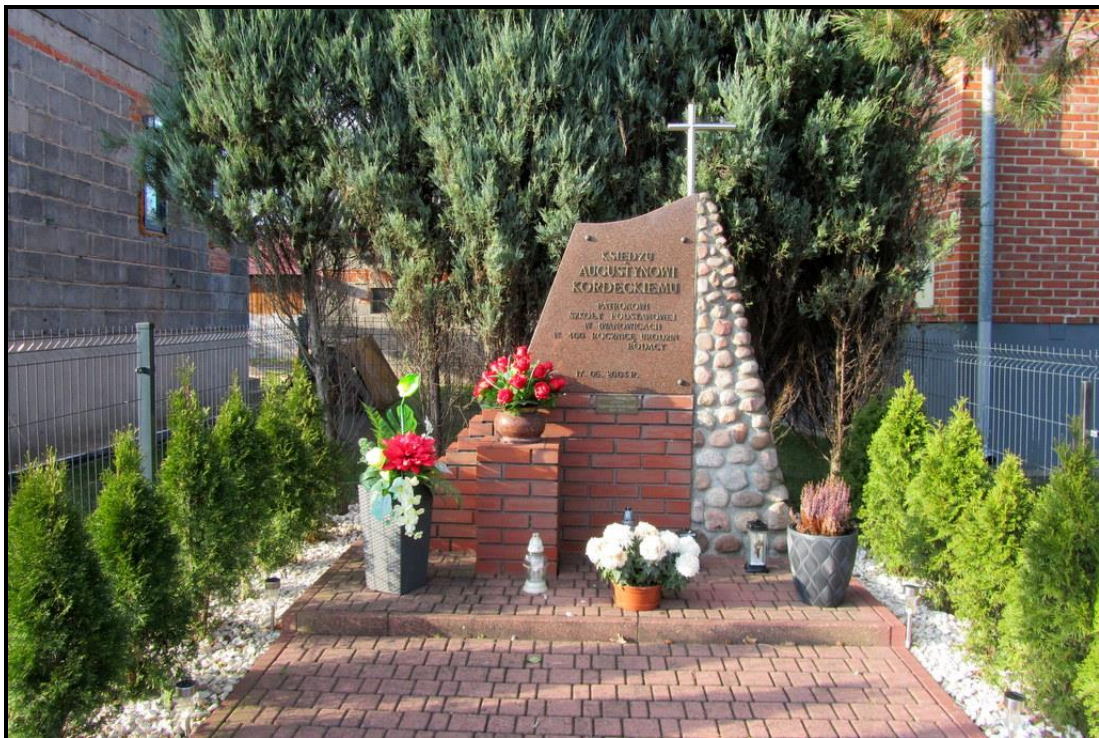
Pomnik upamiętniający ojca Augustyna Kordeckiego

SOŁECKA STRATEGIA ROZWOJU – IWANOWICE wypracowana przez GOW na warsztatach w ramach programu UMWW - „Wielkopolska Odnowa Wsi 2020+”