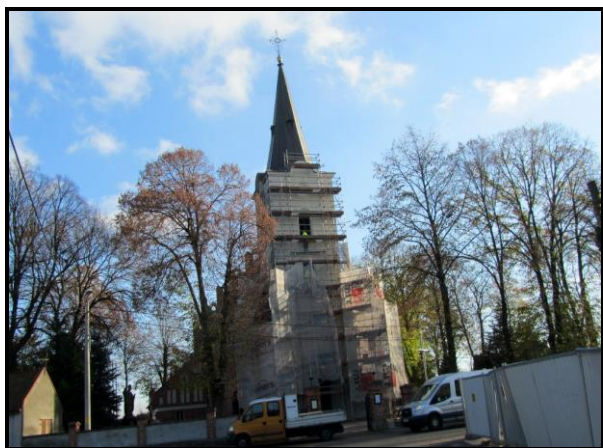
Kościół pw. św. Katarzyny Aleksandryjskiej