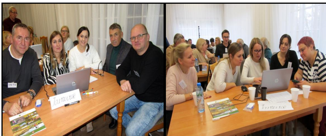
Grupa Odnowy Wsi w czasie warsztatów opracowania Sołeckiej Strategii Rozwoju Urząd Gminy w Szczytnikach w dniach 22-23.XI.2024 r.

SOŁECKA STRATEGIA ROZWOJU – IWANOWICE wypracowana przez GOW na warsztatach w ramach programu UMWW - „Wielkopolska Odnowa Wsi 2020+”