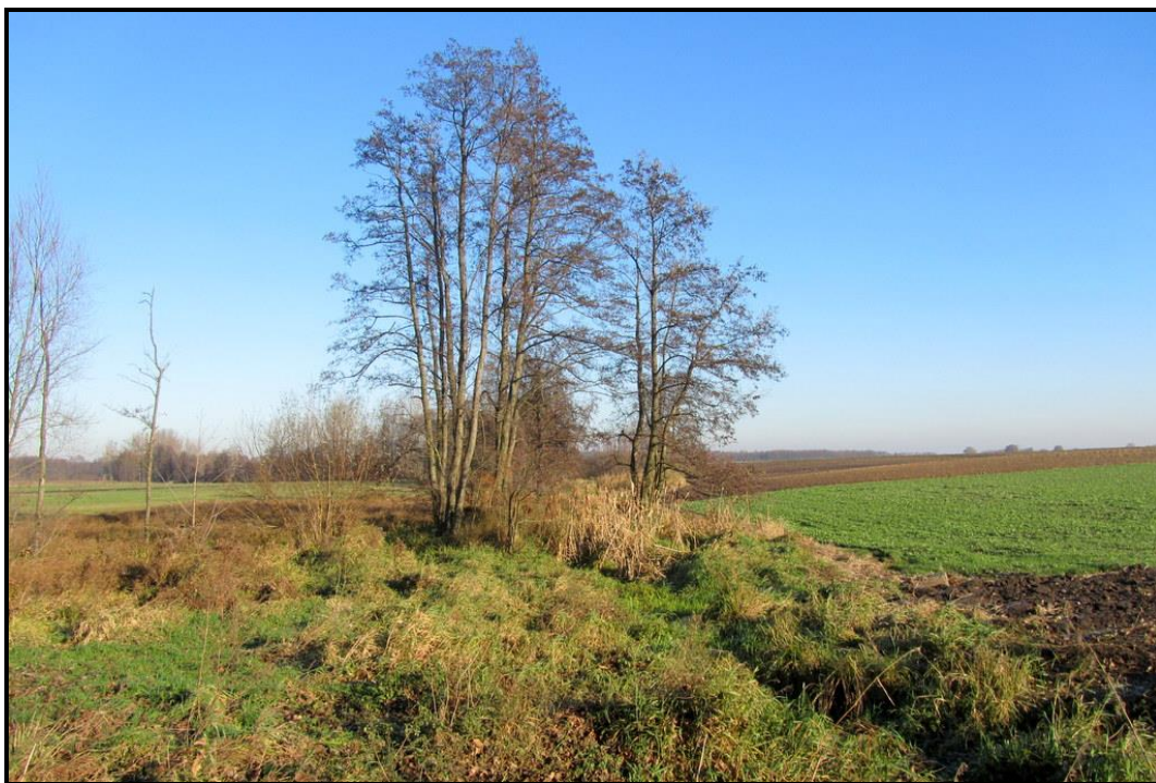
Walory przyrodnicze sołectwa – rzeka Tymianka

SOŁECKA STRATEGIA ROZWOJU – TYMIENIEC wypracowana przez GOW na warsztatach w ramach programu UMWW - „Wielkopolska Odnowa Wsi 2020+”