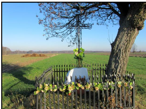
Miejsce kultu religijnego