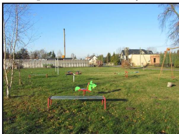
Miejsce sportu i rekreacji