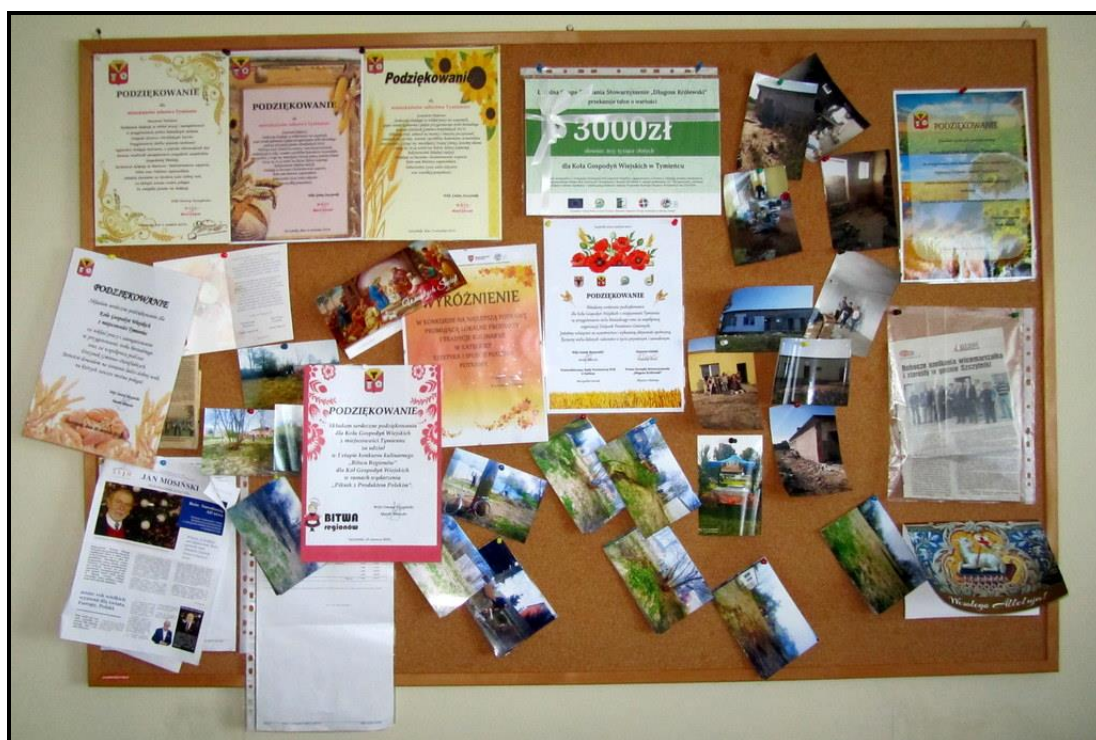
Osiągnięcia i liczne podziękowania dla sołectwa oraz KGW Tymieniec

ZASOBY – wszelkie elementy materialne i niematerialne wsi i związanego z nią obszaru, które mogą być wykorzystane obecne bądź w przyszłości w realizacji publicznych bądź prywatnych przedsięwzięć odnowy wsi. Zwrócić uwagę na elementy specyficzne i rzadkie (wyróżniające wieś). Opracowanie: Ryszard Wilczyński