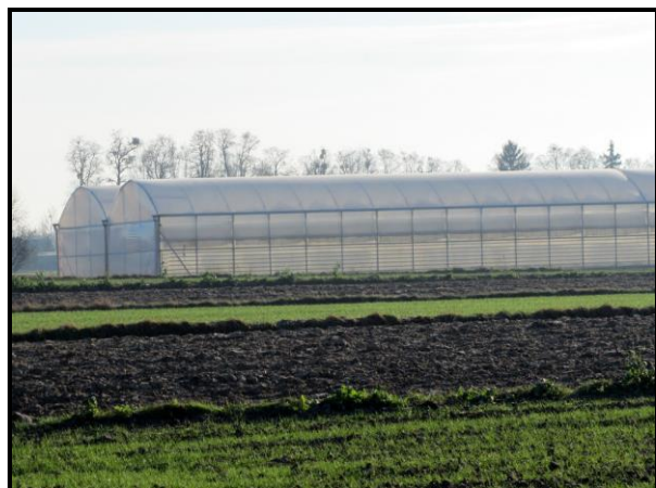
Gospodarstwa rolne uprawa tunelowa warzyw