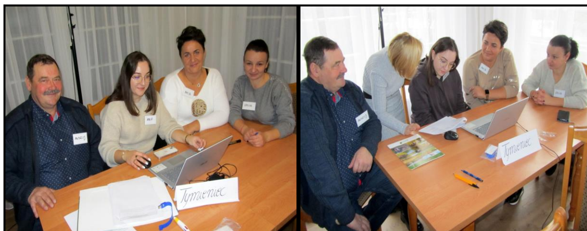
Grupa Odnowy Wsi w czasie warsztatów opracowania Sołeckiej Strategii Rozwoju Urząd Gminy w Szczytnikach w dniach 22-23.XI.2024 r.

SOLECKA STRATEGIA ROZWOJU – TYMIENIEC wypracowana przez GOW na warsztatach w ramach programu UMWW - „Wielkopolska Odnowa Wsi 2020+”