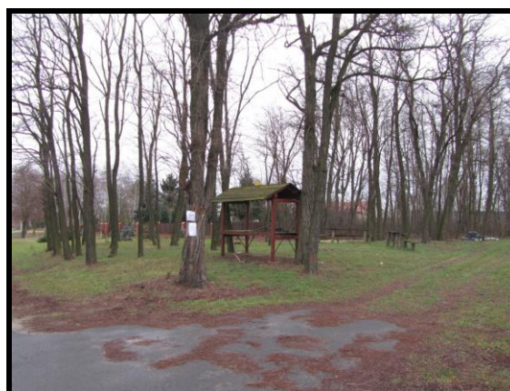
Miejsce spotkań mieszkańców