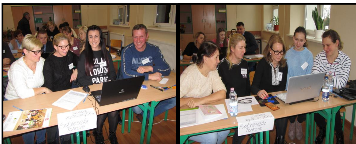
Grupa Odnowy Wsi w czasie warsztatów opracowania Sołeckiej Strategii Rozwoju Szkoła Podstawowa w Iwanowicach w dniach 13-14.I.2023r.

SOŁECKA STRATEGIA ROZWOJU – SOBIESEKI TRZECIE wypracowana przez GOW na warsztatach w ramach programu UMWW - „Wielkopolska Odnowa Wsi 2020+”