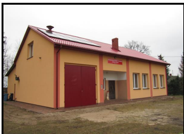
OSP oraz Świetlica wiejska