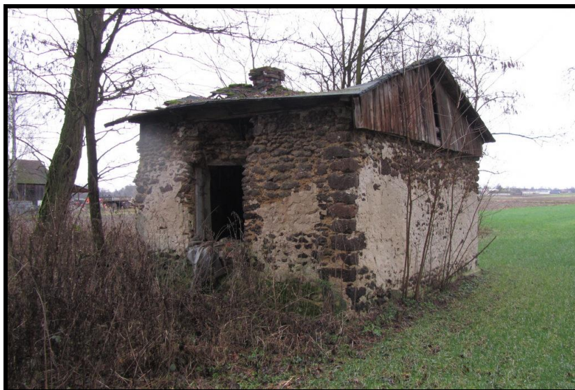
Pozostałości „domu z żelaza” wykonany z gliny i rudy darniowej - ślady osadnictwa Ołęderskiego