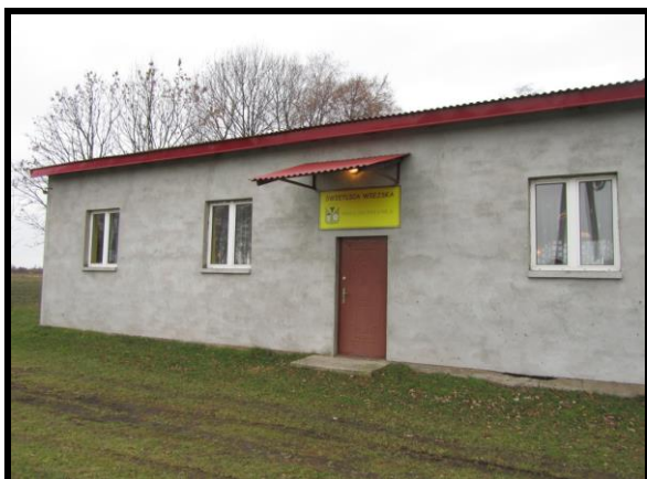
Świątlica wiejska oraz remiza OSP