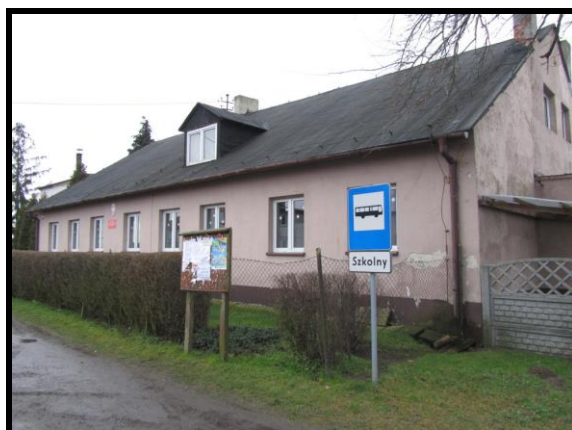
Szkoła Filialna z oddziałem przedszkolnym