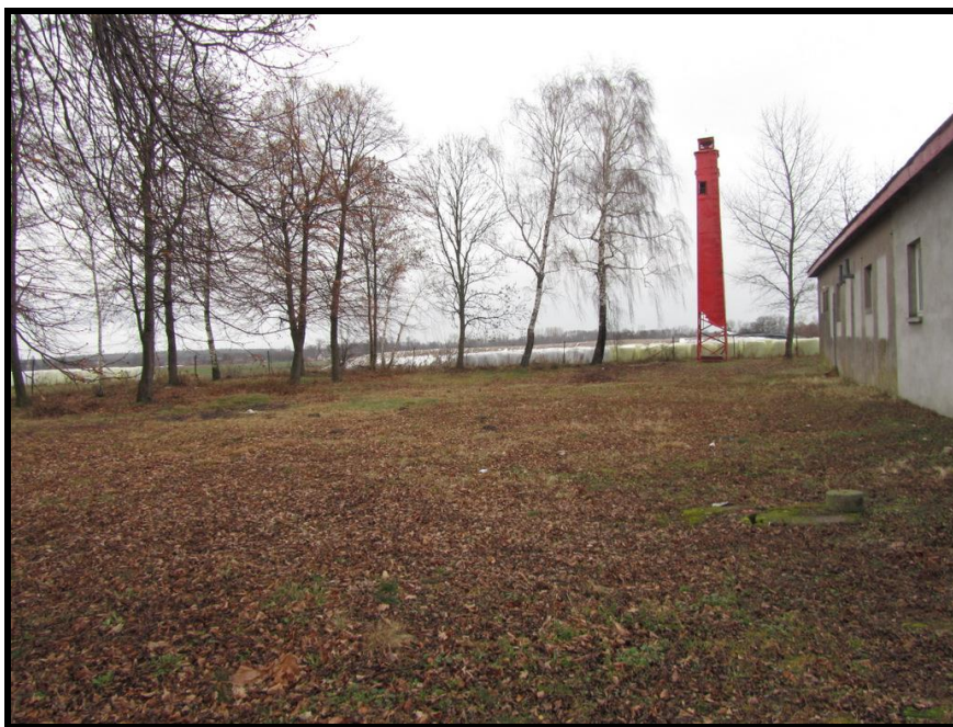
Teren przy świetlicy i remizie OSP