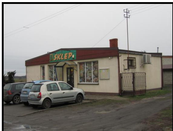
Sklep z art. spożywczymi