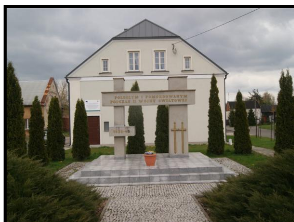
Pomnik poległych i pomordowanych podczas II wojny światowej