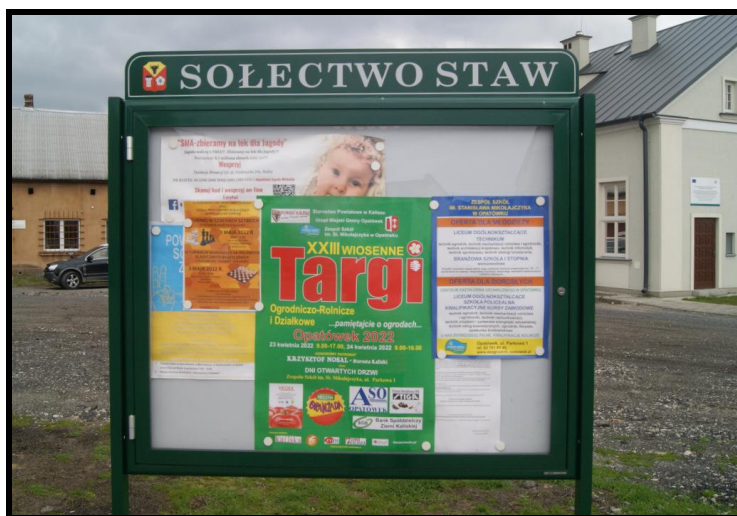
Tablica informacyjna sołectwa

SOLECKA STRATEGIA ROZWOJU – STAW wypracowana przez GOW na warsztatach w ramach programu UMWW - „Wielkopolska Odnowa Wsi 2020+”