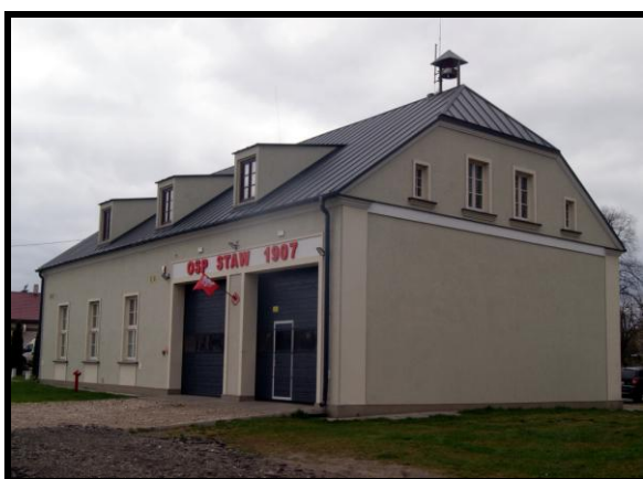
OSP oraz Świetlica wiejska