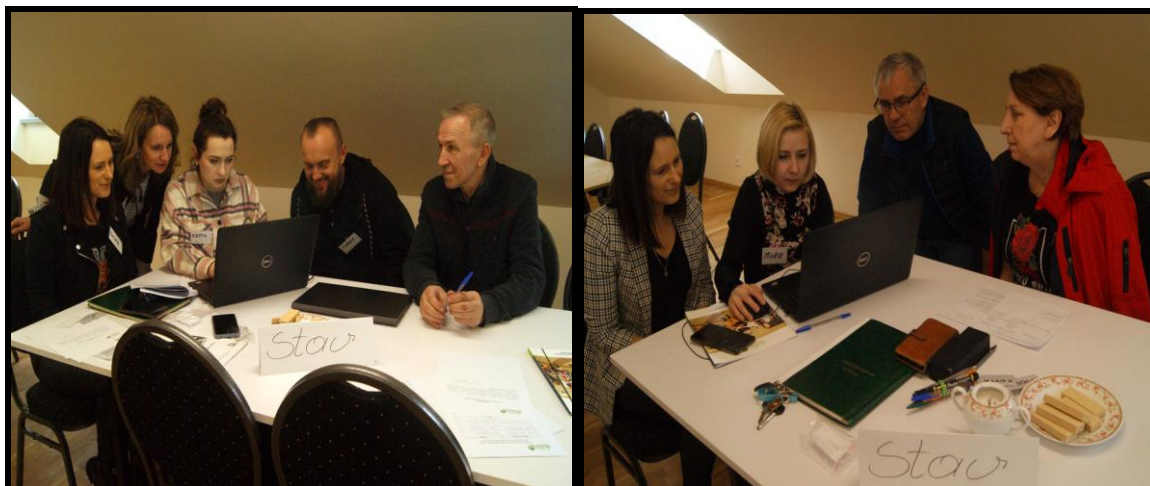
Grupa Odnowy Wsi w czasie warsztatów opracowania Sołeckiej Strategii Rozwoju. Świetlica wiejska w Stawie w dniach 22-23.IV.2022r.

SOLECKA STRATEGIA ROZWOJU – STAW wypracowana przez GOW na warsztatach w ramach programu UMWW - „Wielkopolska Odnowa Wsi 2020+”