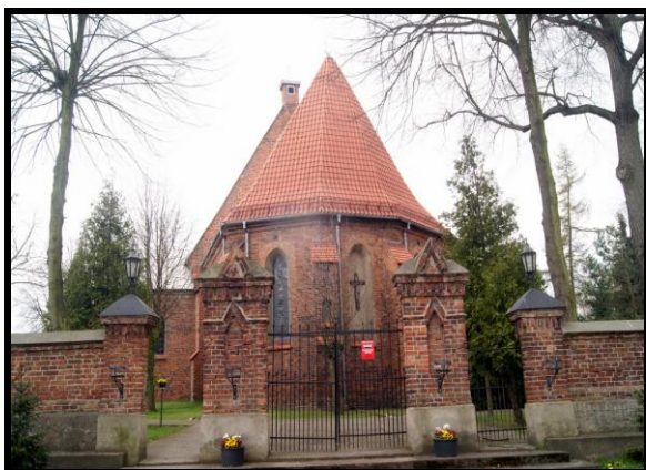
Kościół pw. Świętego Mikołaja