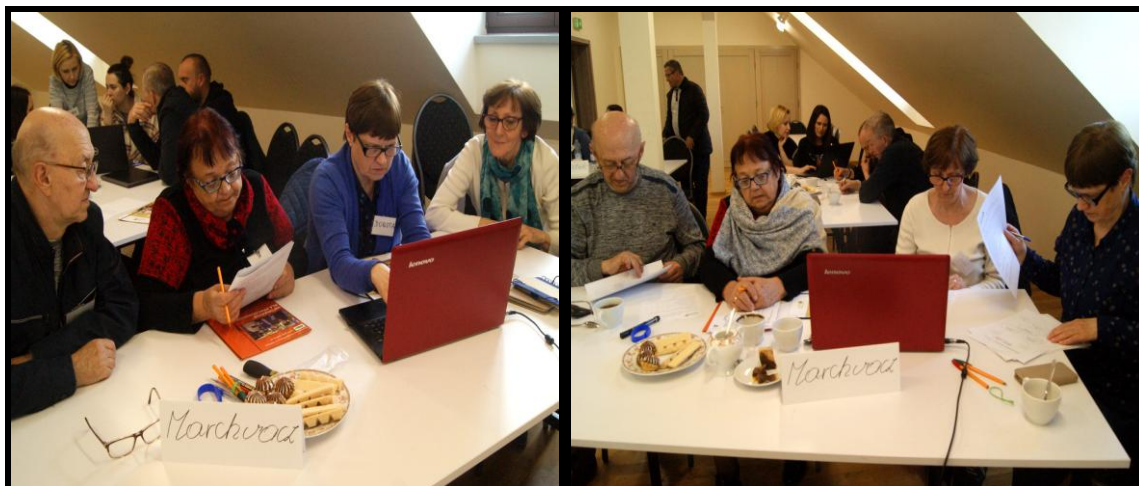
Grupa Odnowy Wsi w czasie warsztatów opracowania Sołeckiej Strategii Rozwoju. Świetlica wiejska w Stawie w dniach 22-23.IV.2022r.

SOLECKA STRATEGIA ROZWOJU - Marchwacz wypracowana przez GOW na warsztatach w ramach programu UMWW - „Wielkopolska Odnowa Wsi 2020+”