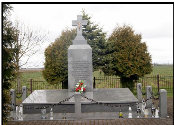
Miejsce pamięci historycznej