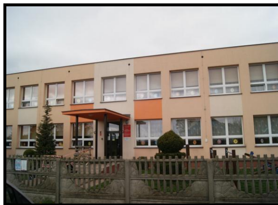
Zespół Szkół im Jana Pawła II