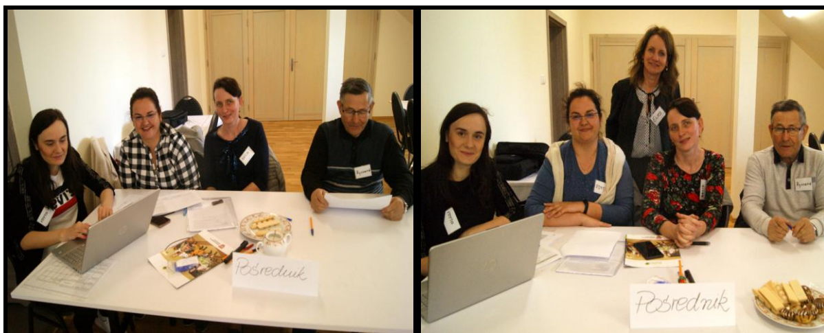
Grupa Odnowy Wsi w czasie warsztatów opracowania Sołeckiej Strategii Rozwoju. Świetlica wiejska w Stawie w dniach 22-23.IV.2022r.

SOLECKA STRATEGIA ROZWOJU - POŚREDNIK wypracowana przez GOW na warsztatach w ramach programu UMWW - „Wielkopolska Odnowa Wsi 2020+”