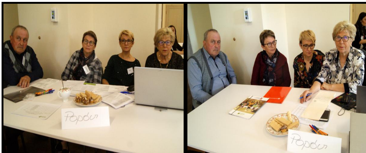
Grupa Odnowy Wsi w czasie warsztatów opracowania Sołeckiej Strategii Rozwoju. Świetlica wiejska w Stawie w dniach 22-23.IV.2022r.

SOLECKA STRATEGIA ROZWOJU - POPÓW wypracowana przez GOW na warsztatach w ramach programu UMWW - „Wielkopolska Odnowa Wsi 2020+”